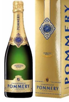
Brut Grand Cru Millésimé